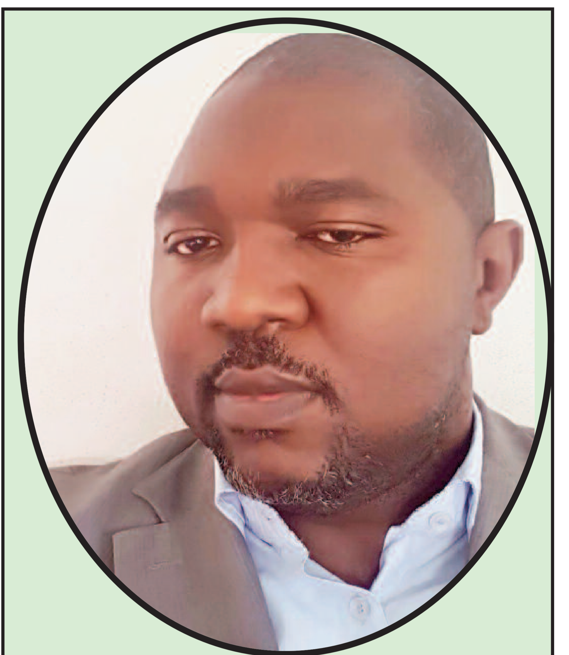
DIRECTEUR DE LA PUBLICATION Alphonse AYISSI ABENA