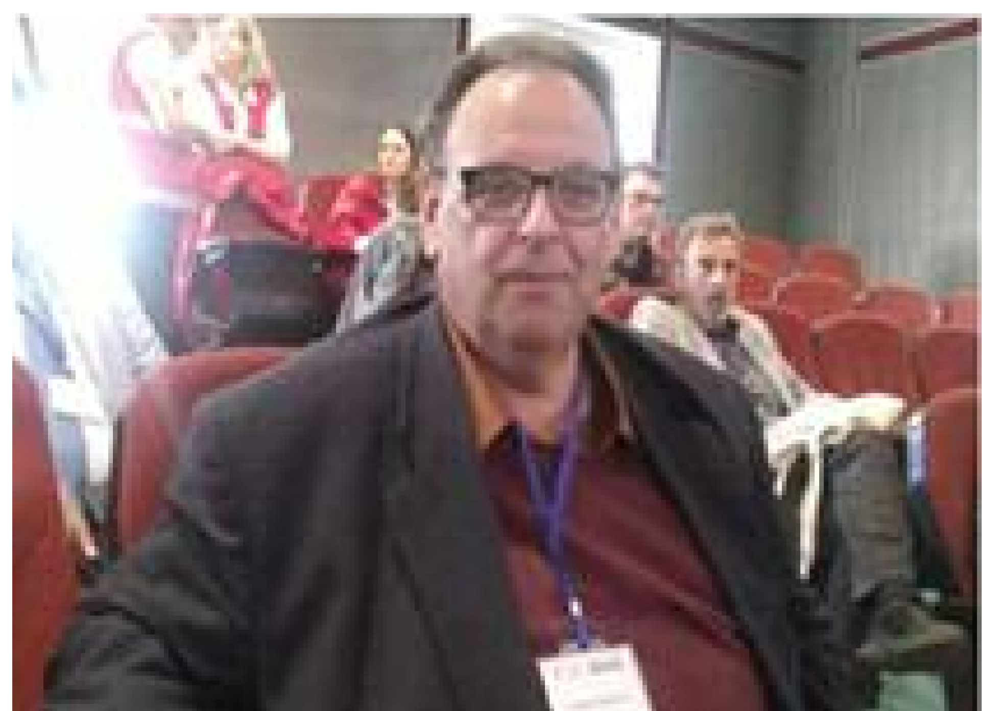
Reportage: Isidoros Karderinis*

SOFIA, Bulgarie — Le dimanche 8 juin 2025, des manifestants se sont rassemblés devant la Banque nationale bulgare, entourés d'un important dispositif policier, pour protester contre l'introduction prévue de l'euro le 1er janvier 2026.